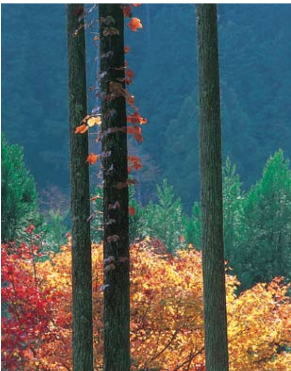
—秋色— 松田 昇 写真集「風土記」より

信濃丸はその後シベリア抑留者の引揚げにも参加、大岡昇平はこの船で復員している。半世紀を超える船歴をひっそりと閉じたのは昭和二十六年でスクラップとして解体された。大戦を生きのびた数少ない老朽商船もこの頃から大方解体されるが、少し異なる