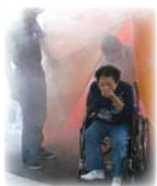
△ 煙が充満「何も見えなかったわ」

続いて煙道体験をしました。消防職員から「煙を吸わないように姿勢を低くして、鼻と口をタオルで覆ってください」と説明を受け、皆さんは緊張した面持ちで煙が充満したトン