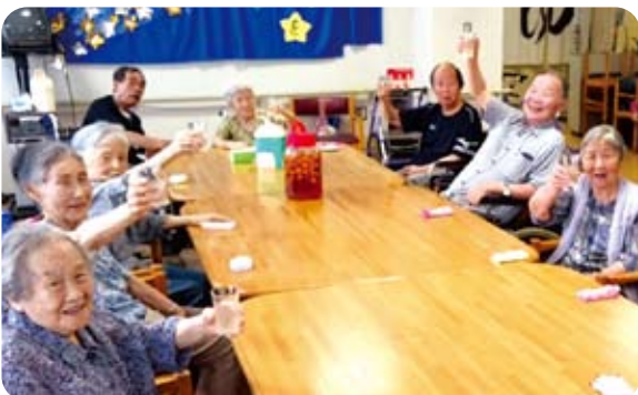
△夏バテ予防の梅ジュースで「カンパニー」