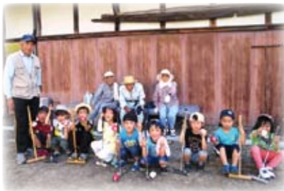
△地域の方にゲートボールを教わっています

子どもたちは、毎日「ただいま」と元気よく学校から帰り、宿題を済ませた後は、友だちと折り紙をしたり読書やゲームあそびなどをして、充実した時間を過ごしています。