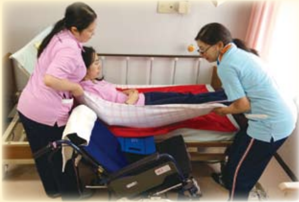
△安全でスムーズな移乗が可能になりました

たご利用者にとっても職員にとっても身体にかかる負担が大幅に軽減していると実感しています。これからも優しい『抱え上げ』の定義を目指して取り組みんでいきます。