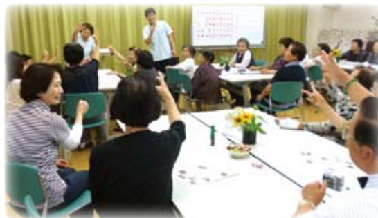
△さあ！優勝は誰の手に

梨ノ木園では、三重県唯一の盲養護老人ホームを地域の方々にもっと知っていただくため、地元の名産、田いきいきサロンの皆様をお招きしました。