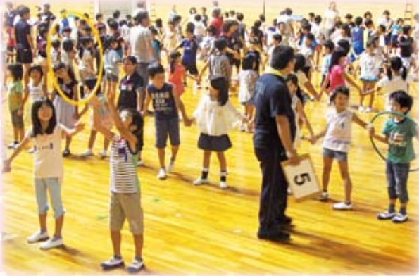
△フープdeゲーム “くぐっておくって”