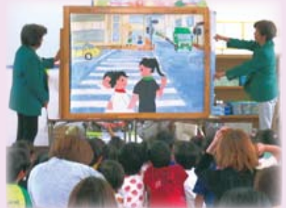
△「右→左→右見て渡ろうね」