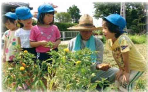
△「ふわふわの花びら触ってごらん」

この体験を通して、子どもらしい発見や驚きがありました。10月12日の芭蕉祭には、子どもたちのつぶやきを献詠俳句として投句したいと思います。