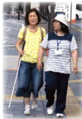
△ 楽しい旅行に出発～

当事業所で行なう同行援護は、視覚障がい者の買い物、食事、余暇等の支援が中心でしたが、今回は、伊賀市視覚障害者福祉会主催の一泊旅行(伊勢方面)にヘルパーが同行しました。