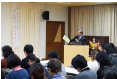
△法人内研修の様子

けています。福祉分野のみならず、幅広く社会全体に目を向け見識を高めることにより、職員一人ひとりが自ら考え、行動できる力を養い、民間福祉事業を担うことのできる職員の養成に努めています。これからも幅広い分野の研修を企画し、研修体制の充実を図りたいと考えています。