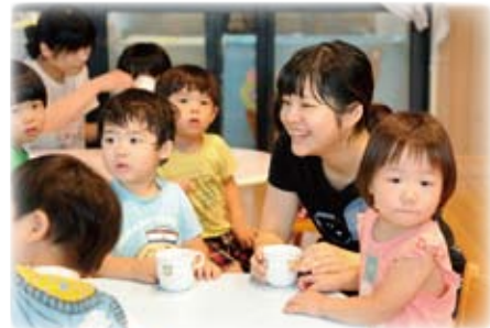
△みんなが輝ける職場です

バリバリ働くもよし! 自分らしい働き方を探してみるのもよし! 少しでも興味がある方はいつでもご連絡をお待ちしています。ご紹介も大歓迎です。