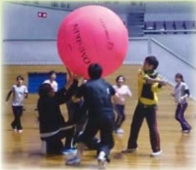
△体を動かし、心も体もスッキリ!

当法人には、職員の相互共済及び親睦、福利増進などを目的とした職員互助会があり、毎年様々な企画を考え、楽しく活動をしています。本年度はキンボール大会、料理教室、フラワーアレンジメント教室などを開催しました。保育・老人・障がい分野で勤務する職員が、職種や年齢を越えて夢中になって思いきり楽しみ、心身をリフレッシュしています!!