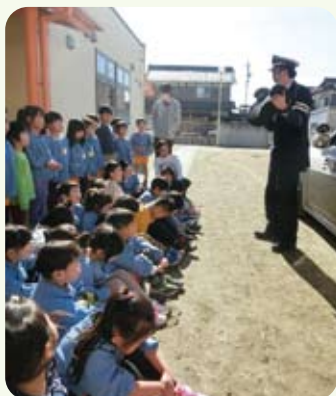
△チャイルドシートの大切さを教わりました

交通安全教室の実施や駐車場での推進活動など、チャイルドシート着用が習慣になるよう啓発活動に努めています。