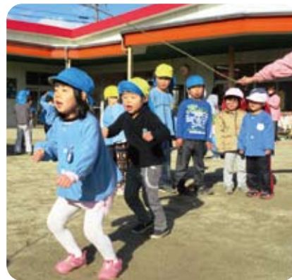
△「1.2.3.4.・・・いっばいとべるよ」

子どもを取り巻く環境や生活様式の変化などにより、子どもが身体を動かして遊ぶ時間が激減し、子どもの体力が低下しているといわれて久しい状況にあります。そこで、本年度、伊賀市では、市内にある34の全保育所(園)で、文部科学省が作成した幼児期運動指針による「からだそだて」に取り組んでいます。当法人の14保育園(所)では、伊賀市版幼児の体力向上実践プログラム「にんにんタイム」に