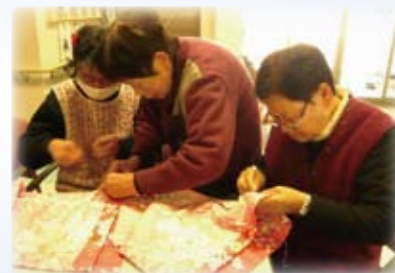
△「ここをしっかりと、しとかんとな」

ほつれてくるから返し縫いをしとこか」などと工夫しながら、袋作りに精を出してくださっています。