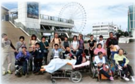
△水族館楽しんできまーす

潮の香り漂う風を感じながら「来られて良かったわ」と笑顔で話され、楽しい一日を過ごされました。