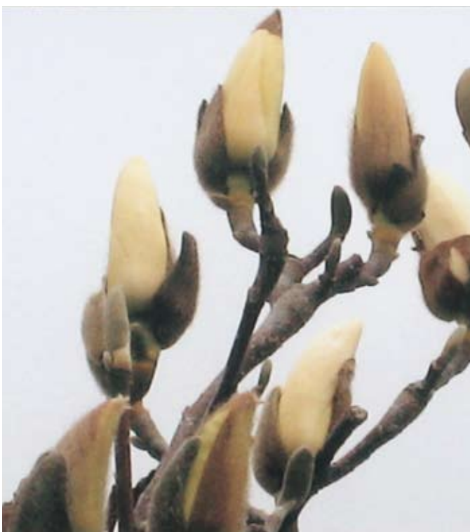
蒼ふくらむ白木蓮

七十数年前の選択を今頃詮索してみても仕方ない、とお考えの方は当然多いであろう。しかし私のように、大陸で育ち、ソ連軍の侵攻を受け、多くの民間人の悲運に接してきた世代にとって、