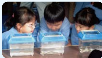
△「いろいろな魚がいるんだね」

するカメ、メダカ、ザリガニ、タニシなどが展示してあり、まるで水族館のようです。「すごい、いっぱいいる」「どうやって捕ったのかな」と子どもたちは水槽の周りに集まり目を輝かせていました。ケースを食い入るように見ながら、担当の方から生き物の特徴や生態を聞き、色や形、動きなどをじっくり観察していました。魚の捕り方や道具にも興味津々、生き物への関心が一層高まりました。 続いて、木津川で拾った石に木津川の生き物の絵を描き、最後に「子どもだけで川へ絶対に行かない」と約束をしました。