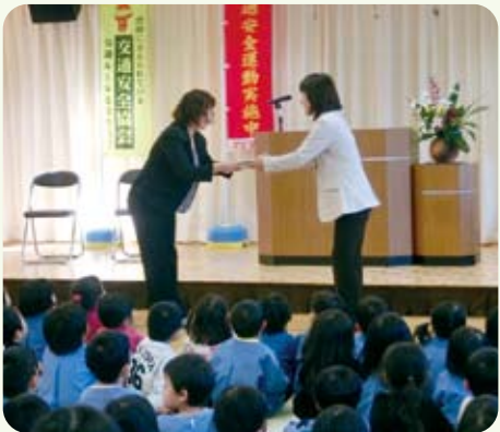
△モデル指定園のバトンタッチ

3・4・5歳児と保護者の方々が見守る中、伊賀警察署長から指定書の交付を受けました。子どもたちは署長からお話を聞き「チャイルドシートを着けます」と約束をしました。保護者には「シートベルトだけでは事故時に子どもの体が飛んでいくので、しっかりとチャイルドシートを着用してあげてください」とお話がありました。当園では、独自に行なった保護者へのアンケート調査の結果をふまえて、