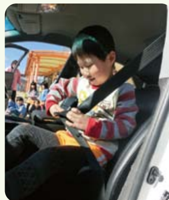
△「カチッとね。ベルトの音でスタートだ」

3・4・5歳児と保護者の方々が見守る中、伊賀警察署長から指定書の交付を受けました。子どもたちは署長からお話を聞き「チャイルドシートを着けます」と約束をしました。保護者には「シートベルトだけでは事故時に子どもの体が飛んでいくので、しっかりとチャイルドシートを着用してあげてください」とお話がありました。当園では、独自に行なった保護者へのアンケート調査の結果をふまえて、