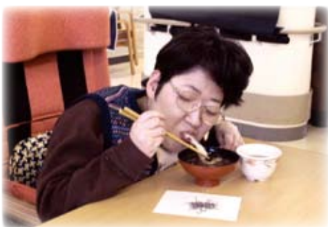
△「お餅どこまでのびるのー」

この日一番のお楽しみは、ぷっくりと焼けたお餅が入ったぜんざい。みんなでホットプレートで囲みお餅を焼きました。ひと口食べるなり「甘くて、お餅が柔らかいから何個でも食べられるわ」と、大満足。ぜんざいを頬張り、一年の無病息災を祈りました。