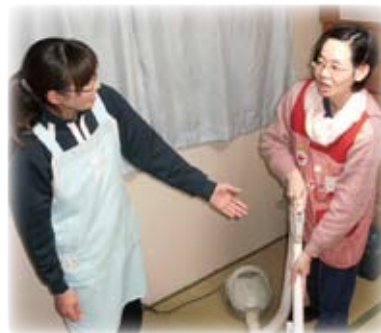
△ヘルパーと談笑するYさん

Yさんは、当事業所の生活介護事業（通所事業）と居宅介護事業（ヘルパー事業）などを利用して、11年になります。ヘルパーとの関わりの中で、洗濯物のたたみ方や、食器の後片付けなど、身の周りの家事が