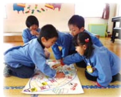
△「次、わたしの番やで・・・」

子どもたちは新春を元気に迎え、お正月おたのしみ会をしました。お正月に経験したことを話し合ったり、年齢の異なる子どもたちがペアを組んで、家庭ではあまりしなくなったカルタやすごろくあそびをしました。すごろくのルールをみんなで決めたり、年下の子が戸惑っていると「今3つ進むんやで」「今度は1回休みや」と優しく教えてあげたりしながら、あそびが展開していきました。「わあ、もうあがりや」と歓声をあげながら、お楽しみ会は大いに盛り上がっていました。