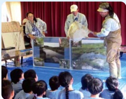
△「川の魚はこんな道具でとるんだよ」

遊水地の看板除幕式に参加し、川や水辺に住む生き物に興味を持った子どもたちは、この学習会を大変楽しみにしていました。会場には、木津川に生息