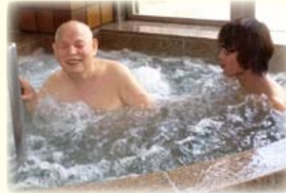
△「泡が気持ちいいな」