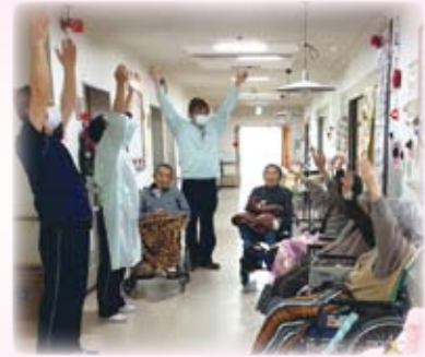
△みんなで元気よく「いち、に! いち、に!」

一日の始まりに、それぞれのスタイルでしっかりと体を動かすことにより、活気と潤いのある一日を過ごしていただける良い刺激となっています。ほんのり汗がにじむくらい身体を動かした後は「あー今朝もスッキリした」と、爽快感で思わず顔もほころびます。