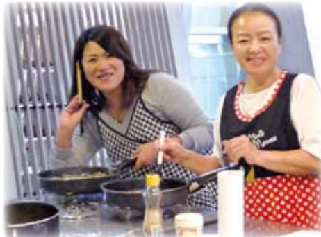
△「いい匂いがしてきたよ」

当法人には、職員の相互共済及び親睦、福利増進などを目的とした職員互助会があり、毎年様々な企画を考え、楽しく活動をしています。本年度はキンボール大会、料理教室、フラワーアレンジメント教室などを開催しました。保育・老人・障がい分野で勤務する職員が、職種や年齢を越えて夢中になって思いきり楽しみ、心身をリフレッシュしています!!